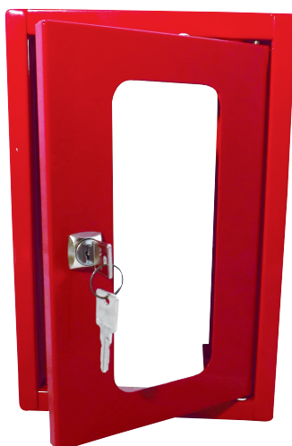
BAV2 L 200 x H 300 x P 130 mm Vitre de rechange : 220 x 125 mm