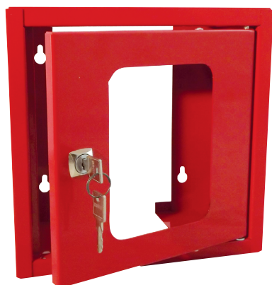
BAV1 H 250 x L 250 x P 150 mm Vitre de rechange : 170 x 170 mm