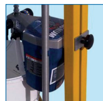
Réglage de la hauteur de la pompe : pour sortir la crépine