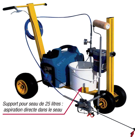
Support pour seau de 25 litres : aspiration directe dans le seau