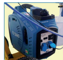
Groupe électrogène : 1100 W Autonomie Illimitée (carburant SP 95)